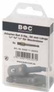
Bitsadaptersæt 1/4", 3/8" og 1/2".