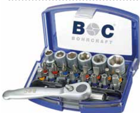
Bitssæt med toppe og skralde.