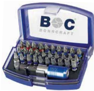
PB 31 Blå bitssæt med 1/4 bitsholder.